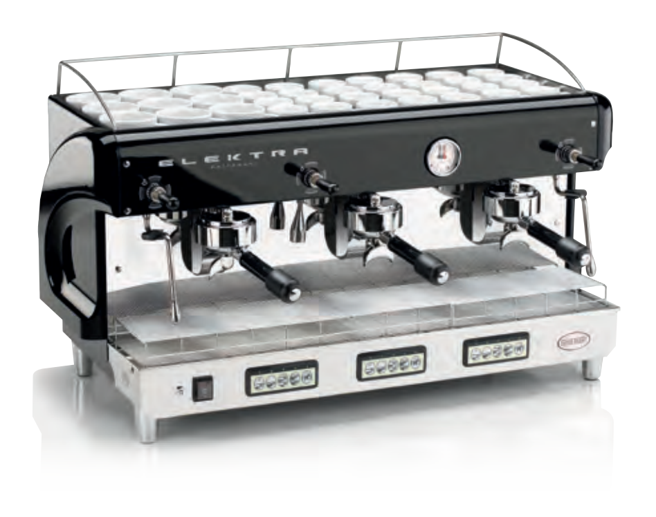
MODERN U1-B. 3 GRUPPI AUTOMATICA. NERO PERLATO MODERN U1-B. 3 UNITS AUTOMATIC. PEARL BLACK