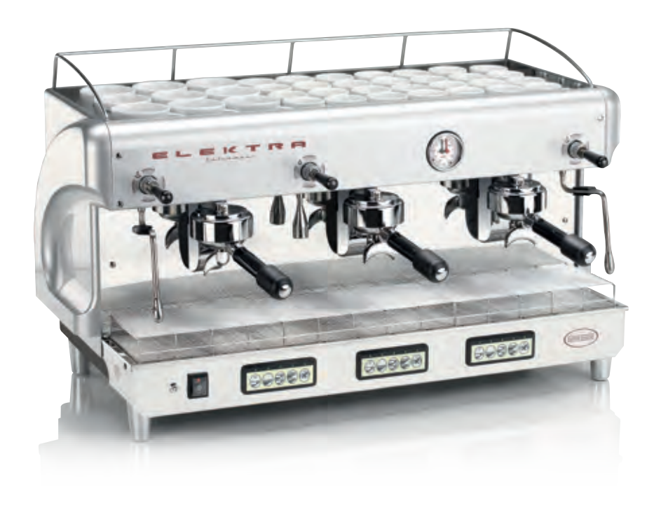
MODERN U1-S. 3 GRUPPI AUTOMATICA. SILVER PERLATO MODERN U1-S. 3 UNITS AUTOMATIC. PEARL SILVER