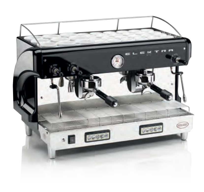
MODERN T-B. 2 GRUPPI AUTOMATICA. NERO PERLATO MODERN T-B. 2 UNITS AUTOMATIC. PEARL BLACK