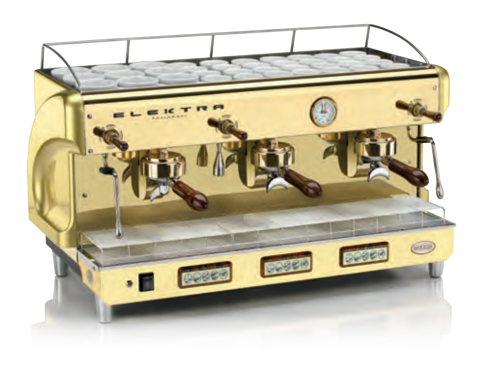
GOLD U1-G. 3 GRUPPI AUTOMATICA. OTTONE "ORO" GOLD U1-G. 3 UNITS AUTOMATIC. BRASS "GOLD"