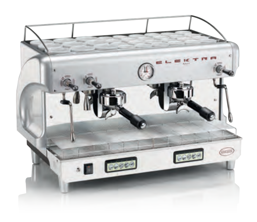
MODERN T-S. 2 GRUPPI AUTOMATICA. SILVER PERLATO MODERN T-S. 2 UNITS AUTOMATIC. PEARL SILVER