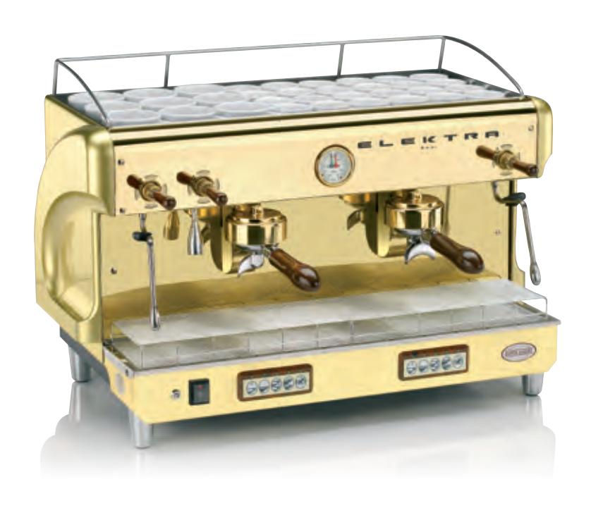
GOLD T-G. 2 GRUPPI AUTOMATICA. OTTONE "ORO" GOLD T-G. 2 UNITS AUTOMATIC. BRASS "GOLD"